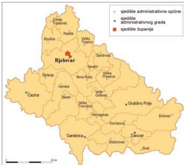
Slika 1. Karta Bjelovarsko-bilogorske županije

BBŽ smještena je na sjeverozapadu Hrvatske. Zauzima površinu od 2652 km 2 , što je 3,03% od ukupne površine Hrvatske. Središte županije je grad Bjelovar, političko, kulturno i gospodarsko središte županije i u njemu se nalaze mnogobrojne institucije koje svojim aktivnim djelovanjem daju primjeren značaj gradu. Tu su još i gradovi Daruvar, Čazma, Garešnica i Grubišno Polje, koji svojim posebnostima i specifičnostima u gospodarskom i društvenom životu daju cjelovitu sliku područja Bjelovarsko-bilogorske županije.