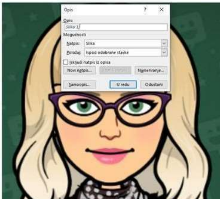
Slika 1. Djevojka s ljubičastim naočalama